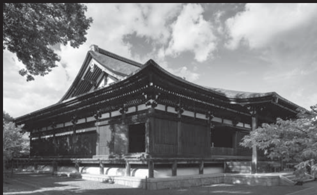
大報恩寺 本堂(国宝) 外観

本堂は、応仁の乱をはじめとする幾多の戦火を免れ、洛中最も古の木造建築物として国宝に指定されています。