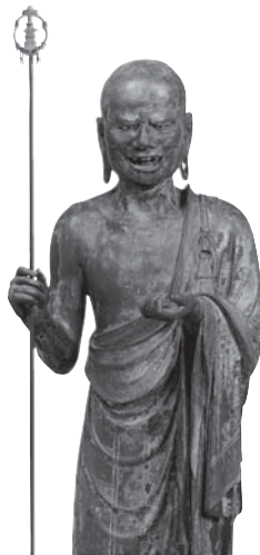
213 ◎ 大迦葉立像