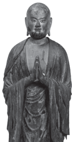
210 ◎ 阿難陀立像