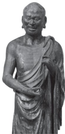
214 ◎ 須菩提立像