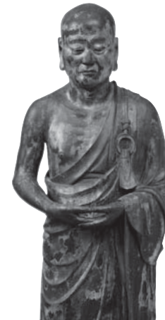
216 ◎ 迦旃延立像