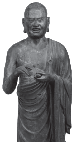
219 ◎ 羅睺羅立像