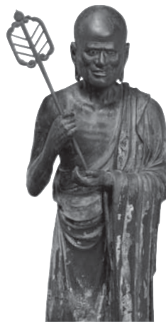
211 ◎ 舍利弗立像