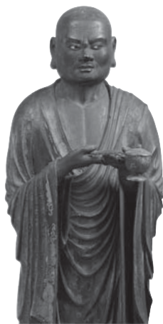
215 ◎ 富楼那立像