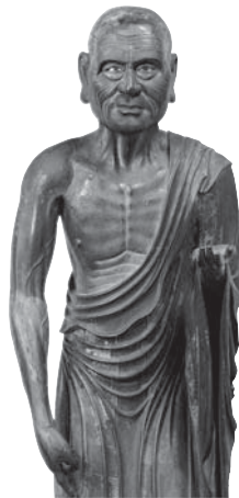
212 ◎ 目犍連立像