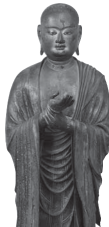
217 ◎ 阿那律立像