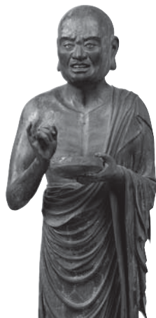
218 ◎ 優婆離立像